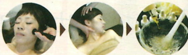
お肌の奥の細胞に 働きかけ減少した コラーゲンを増幅