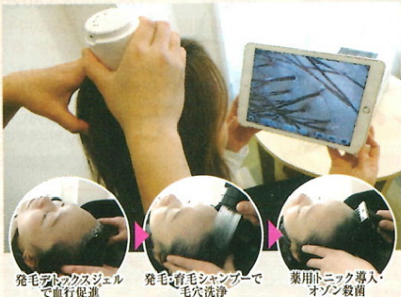
発毛アトックスジェル で血行促進